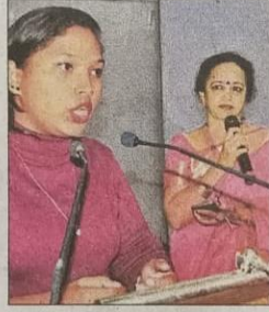
सेंट जेवियरस कॉलेज में बुधवार को बोलती गोवा की प्रतिनिधि।